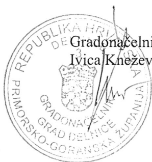
Gradonačelnik Ivica Knežević, dipl.iur

(4) Grad Delnice će o primjeni cjenika obavijestiti tržišnu inspekciju, Agenciju i županijski ured nadležan za poslove gospodarstva sukladno čl.33, st.11. Zakona.